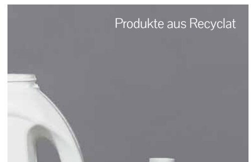
Produkte aus Recyclat