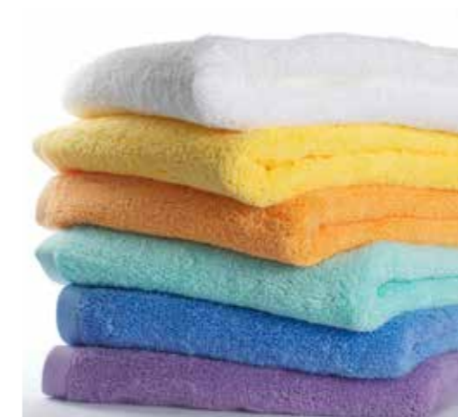
PLAIN TOWELS TOALLAS LISAS