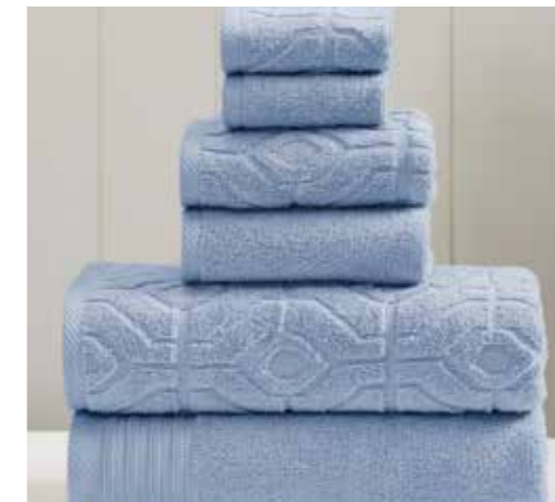
JACQUARD TOWELS TOALLAS JACQUARD