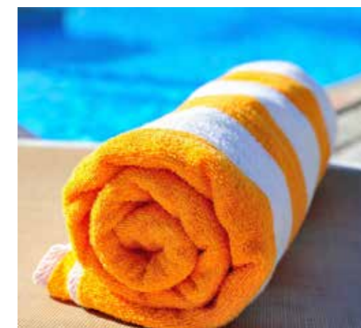
POOL TOWELS TOALLAS DE PISCINA