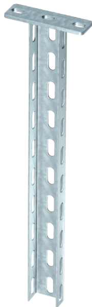
Hängestiel (U-Profil) in der Abmessung 50 x 30 mm mit angeschweißter Kopfplatte.