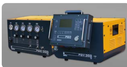
Gasversorgung manuell: PGE-300, automatisch: PGV-300 Gas supply manual: PGE-300, automated: PGV-300