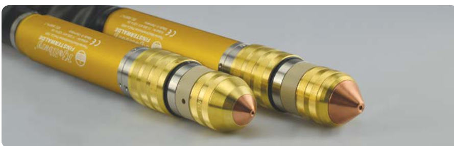
PerCut-Brenner: auch für Fasenschnitte bis 50° | PerCut torches: also for bevel cutting up to 50°

3 Formiergas | forming gas F5 (95 % N 2 , 5 % H 2 )