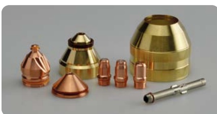
Verschleißteile mit langer Lebensdauer Consumables with long lifetime