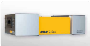
Q-Gas: automatische Plasma-Allgaskonsole Q-Gas: Automatic plasma all-gas console

Einsetzbar für die gesamte Anlagenreihe | Can be used for the entire series