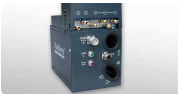
Q-Port: Plasmabrenner-Anschlusseinheit Q-Port: Plasma torch connection unit