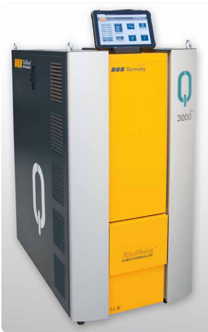
Q-Source mit Q-Desk: Plasmastromquelle mit Human Machine Interface Q-Source with Q-Desk: Plasma power source with human machine interface